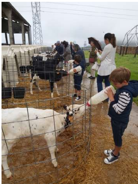
ayudando a alimentar a los terneros

El domingo 12 de junio de 2022 tuvo lugar la visita didáctica-cultural a la Granja de Cudaña, situada en Labarces (Valdáliga), para conocer el proceso total de producción lechera y de quesos. Con una alta mecanización de las instalaciones con controles telemáticos para la alimentación y el ordeño de las vacas lecheras y también la producción de diferentes tipos de quesos ( https://www.granjacudana.com ).