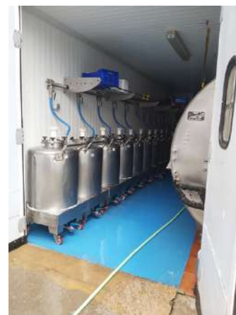
tanques de leche