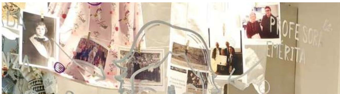
vista del escaparate en Santander.

consistía en mostrar a esas mujeres científicas a lo largo de su trayectoria vital por medio de fotografías de en escaparates de Cantabria. Participaron muchos comercios en la actividad instalando en sus escaparates imágenes de la vida académica (desde la infancia) de las investigadoras junto con sus logros.